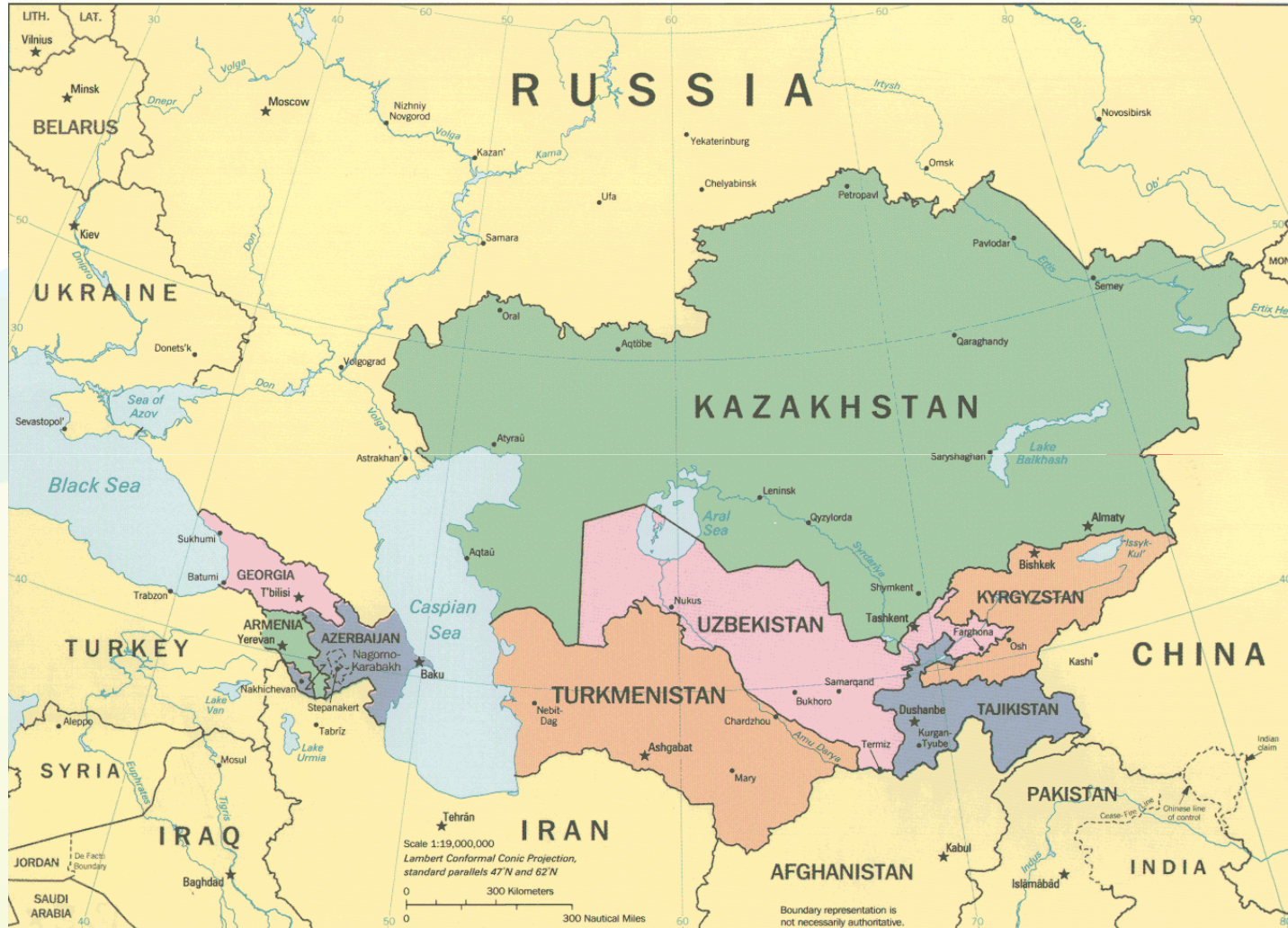
The Caucasus and Central Asia